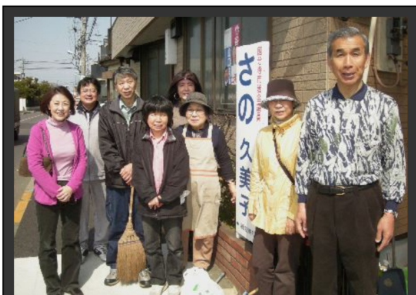
(清掃をしてくださった党员の方々)

3月13日、党员有志の方々を中心に年1回の地域清掃を行いました。昨年と同様、暖かな陽光まぶしい朝の10時から約1時間、内藤橋を中心に日吉フードセンター前までと内藤1・2丁目を通る幹8号線の両側のゴミ拾いを敢行。年々、ゴミの量は減りはじめ、今年も昨年よりゴミが減りました。目立つのは、タバコの吸殻。まだまだ、歩きタバコは多いようです。きれいになった道路や舗道はきもちのいいものです。参加者の皆様、本当にお疲れ様でした。また、来年もよろしくお願いたします。ともに、地域のために頑張りたいと思います。