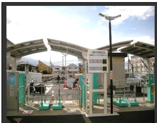
(西国分寺駅北口自転車駐輪場)